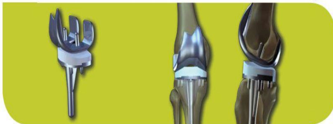
Illustratie van een totale knieprothese

Driessen omschrijft de operatie als ingrijpend. "Na vijf tot zeven dagen mag de patiënt naar huis. Maar dan volgt een periode van revalidatie en dus veel oefenen. Vooral het buigen en strekken van de knie is belangrijk." Al met al duurt het volgens de kniespecialist zeker een half jaar voordat de patiënt weer volledig op de been is. "Zonder pijn en met een sterk verbeterde loopfunctie." ::